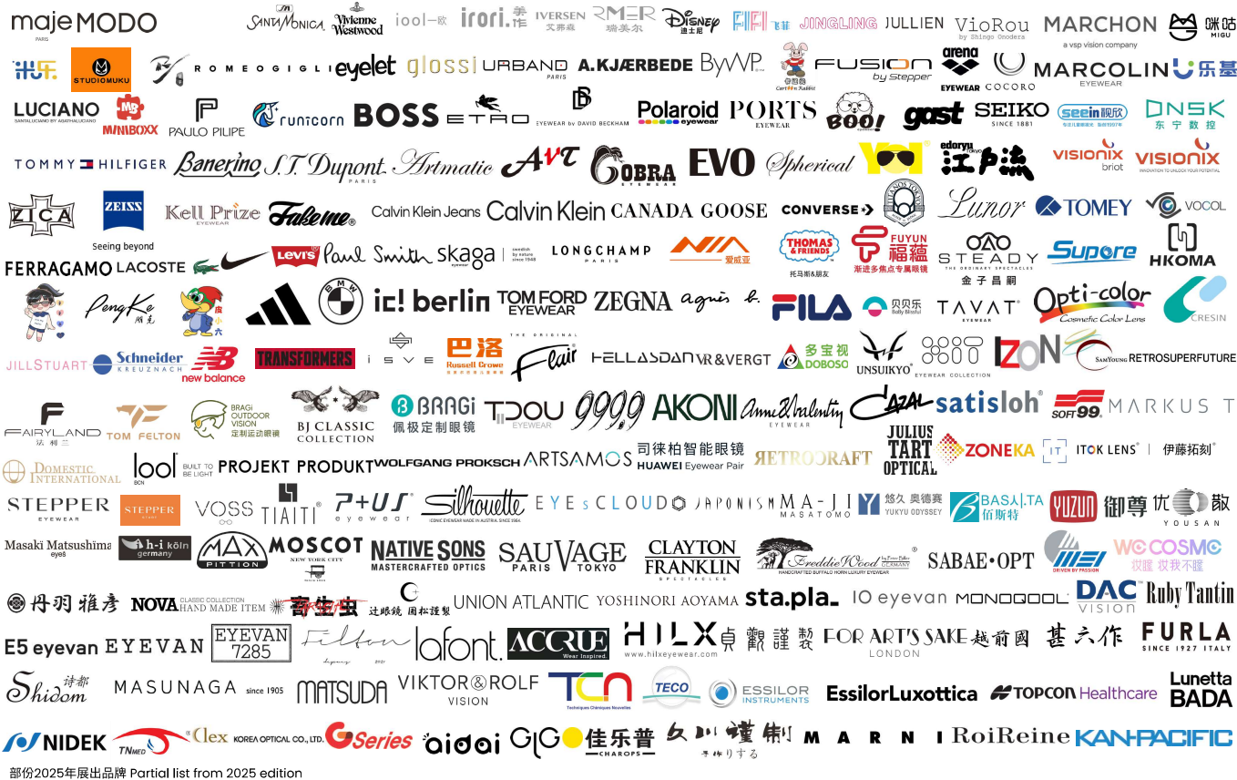
部份2025年展出品牌 Partial list from 2025 edition